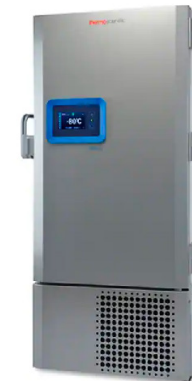
Thermo Scientific™ Congélateurs ultra-basse température série TSX ✦