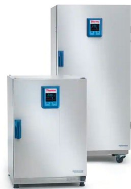
Thermo Scientific™ Incubateurs réfrigérés Heratherm™