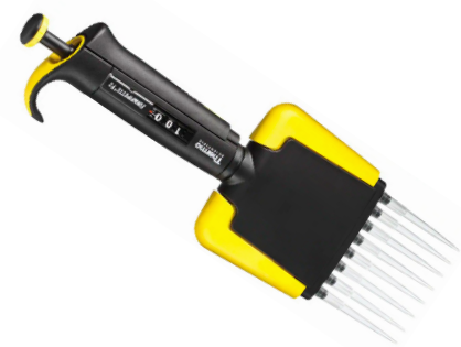
Thermo Scientific™ Pipettes multicanaux Finnpipette™ F2