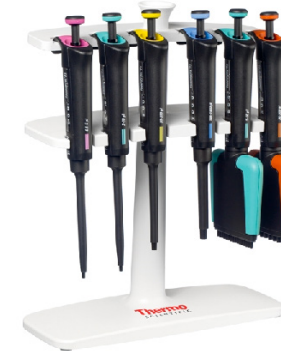
Thermo Scientific™ Pipettes à volume fixe Finnpipette™ F2