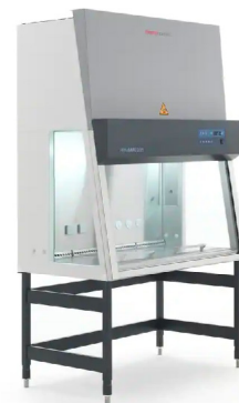
Thermo Scientific™ Poste de sécurité microbiologique de classe II Herasafe™ 2025 ✦