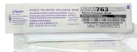
Texwipe™ Écouvillons stériles en polystyrène ✦