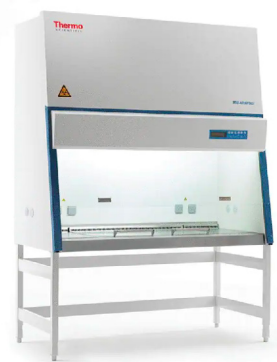
Thermo Scientific™ Postes de sécurité microbiologique de classe II MSC-Advantage™ ✦