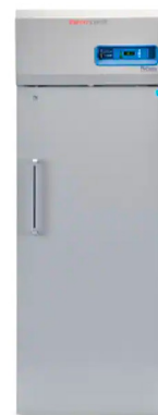
Thermo Scientific™ Congélateurs à dégivrage Auto hautes performances de la série TSX ✦