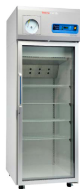
Thermo Scientific™ Réfrigérateurs de laboratoire haute performance série TSX ✦