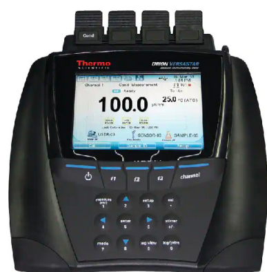
Thermo Scientific™ Conductimètre de paillasse ✦ Orion™ Versa Star Pro™