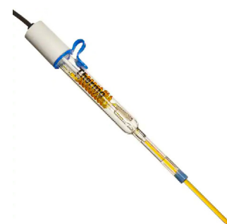
Thermo Scientific™ Microélectrode ✦ de pH combinée Orion™ PerpHecT™ ROSS™