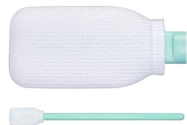
Texwipe Grand écouvillon stérile en polyester ✦