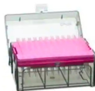
Thermo Scientific™ Embouts de pipettes à filtre ClipTip™ ✦

Découvrez la gamme complète des solutions de manipulation de liquides de Thermo Scientific™