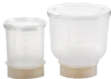
Pall Entonnoir de filtration MicroFunnel™ ST avec membrane Supor™ ✨