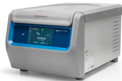
Thermo Scientific™ Série de centrifugeuses Multifuge X1 Pro ✦