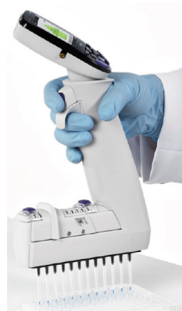
Thermo Scientific™ Pipettes multicanaux E1-ClipTip™ Equalizer ✦