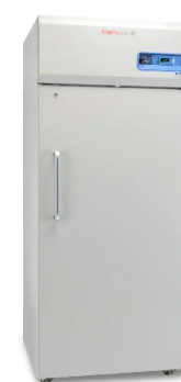
Thermo Scientific™ Congélateurs à dégivrage manuel hautes performances de la série TSX ✦