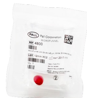
Pall Entonnoir de filtration MicroFunnel™ ST avec membrane GN-6 Metricel™ ✨