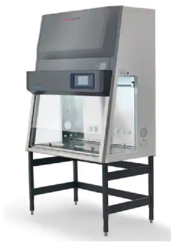
Thermo Scientific™ Postes de sécurité microbiologique Herasafe™ 2030i ✦

* Herasafe 2030i ** modèles de la série CTS