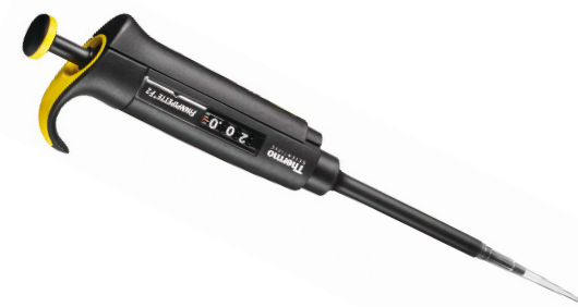
Thermo Scientific™ Pipettes à volume variable Finnpipette™ F2